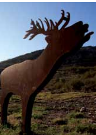
Turismo de Pontevedra