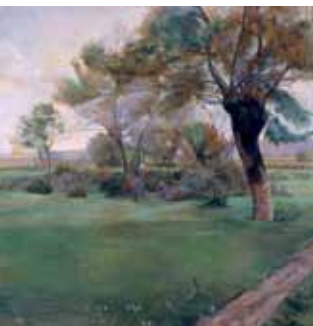
Museo de Bellas Artes

Lehenengo arte-adierazpenetatik hasita, artea izadian inspiratu izan da beti, bertako elementuak imitatu eta erreproduzitzeko xedearekin. Hala, naturala den hori –animaliak, landareak, paisaiak, giza gorputzak...– leialtasun handiagoz edo txikiagoz irudikatzea, edo haren funtsa harrapatu eta “artistikoki” adieraztea, izan da betidanik artistaren helburua.