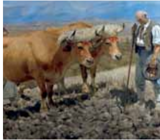
Museo de Bellas Artes

La visita por dos de los museos de Vitoria-Gasteiz, el de Bellas Artes y el de Arte Sacro, nos ofrecerá la posibilidad de aunar arte y naturaleza. Una iniciativa original e interesante, en la que se pretende elegir un buen número de obras de arte significativas –pictóricas y escultóricas– para analizar, además de su valor artístico, la flora y fauna representadas en las mismas.