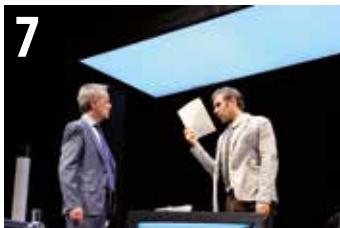
EL CRÉDITO | TRASGO PRODUCCIONES abuztuak 6, 7 agosto