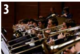
EGO. EUSKAL HERRIKO GAZTE ORKESTRA uztailak 21 julio