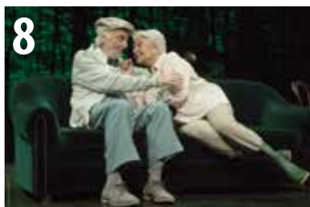
EN EL ESTANQUE DORADO | PENTACIÓN abuztuak 8, 9 agosto