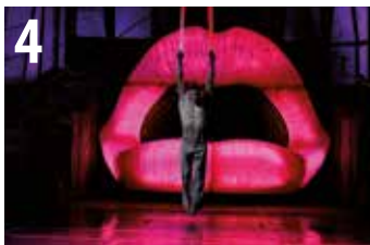
THE HOLE | LETSGO COMPANY & VÉRTIGO TOURS uztailak 30, 31 julio abuztuak 1, 2 agosto