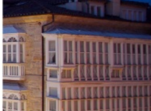
ruta de los museos