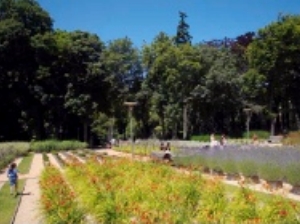
parque de la florida