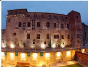
catedral de santa maría