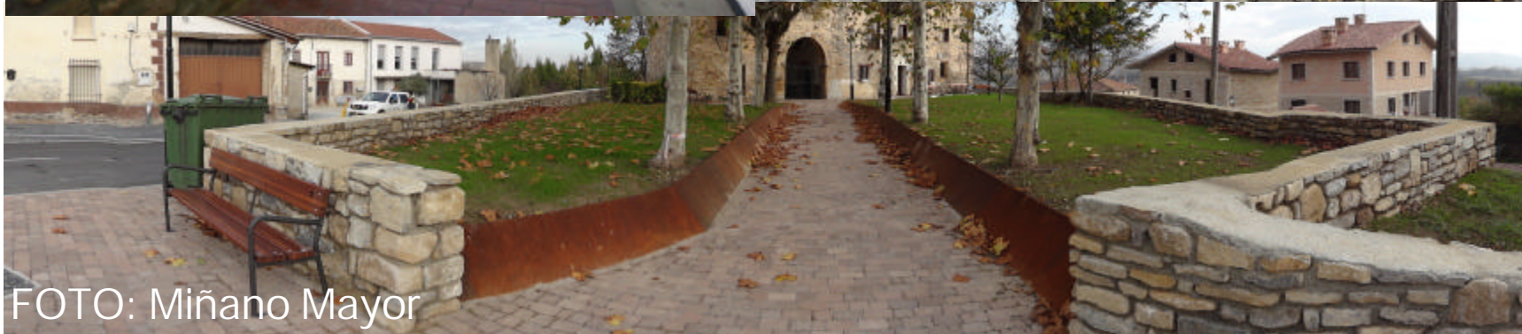
FOTO: Miñano Mayor