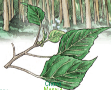
CHOPALA MAKALA Populus x canadensis