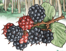
ZARZAMORA LAHARRA Rubus ulmifolius