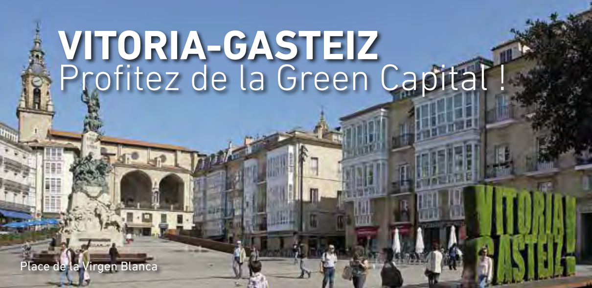
Place de la Virgen Blanca

V itoria-Gasteiz est surprenante par nature. C'est l'une des villes européennes qui compte le plus d'espaces verts, idéale pour se balader, courir ou faire du vélo, observer les oiseaux ou faire des promenades à cheval. Récompensée par le prix « European Green Capital 2012 », Destination Touristique Durable depuis 2016 et nommée 'Global Green City 2019', l'attachement de la ville à l'environnement est internationalement reconnu. Découvrez-la !