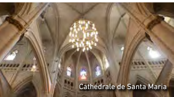
Cathédrale de Santa Maria

une époque passée. C'est le cas de la Cathédrale de Santa Maria ou de l'Ancienne Cathédrale (XIII e siècle) et des Remparts Médiévaux (XI e siècle), des sites d'intérêt à ne pas manquer. Sans oublier ses églises et ses palais de la Renaissance comme Villa Suso, Montehermoso et Escoriaza-Esquivel.