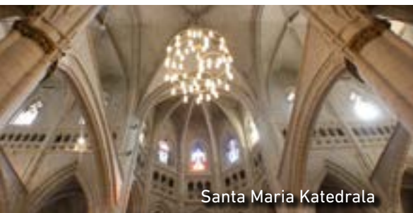
Santa Maria Katedrala

eta bisitaria antzinako garaietara eramaten duten txokoak ezkutatzeko. Santa Maria katedralaren edo Katedral Zaharraren (XIII. mendea) eta Erdi Aroko harresiaren (XI. mendea) kasua da hori; biak ala biak nahitaez ikusi behar direnak. Hala ere, ezin ditzakegu ahaztu bere elizak eta Goiuri, Montehermoso eta Eskoriatza-Eskibel jauregi errenazentistak.