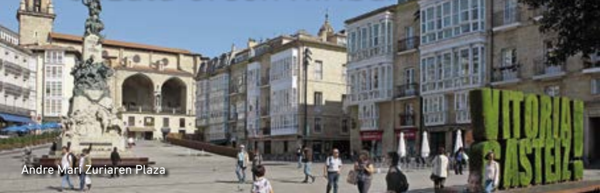
Andre Mari Zuriaren Plaza

G asteiz berez da harrigarria. Europan, berdeguneen azalera handienetakoa duen hiria da; bai pasieran ibiltzeko, korrika egiteko edo bizikletaz ibiltzeko, bai hegaztiak ikusteko, bai zaldiz ibiltzeko.