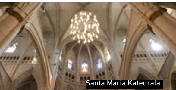
Santa Maria Katedrala

eta bisitaria antzinarra garaietara eramaten duten txokoak ezkutatzeko dituzte. Santa Maria katedralaren edo Katedral Zaharraren (XIII. mendea) eta Erdi Aroko harresiaren (XI. mendea) kasua da hori; biak ala biak nahitaez ikusi behar direnak. Hala ere, ezin ditzakegu ahaztu bere elizak eta Goiuri, Montehermoso eta Eskoriatza-Eskibel jauregi errenazentistak.