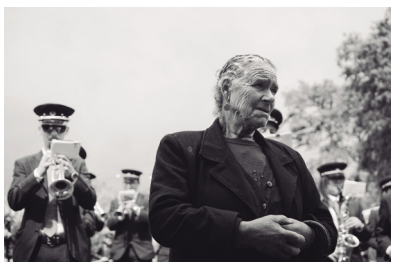
1. saria | 1º premio. 2019 "Con la banda detrás" António Tedim

Cualquier consulta sobre el concurso puede dirigirse a la siguiente dirección de correo electrónico: fotoarte@vitoria-gasteiz.org