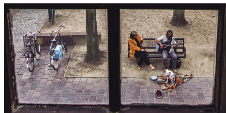
3. saria | 3º premio. 2019 "Grabando un recuerdo" Alejandro Pérez García

Epaimahaiak jasotako lanen artean 32 lan aukeratu ditu, eta, horien artean, lehiaketaren saridunak.