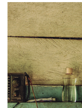
2. saria | 2º premio. 2019 "Anytime, Anywhere" Miguel González Balbuena

Las fotografías no recogidas antes del 2 de diciembre de 2020 quedarán en propiedad del Ayuntamiento de Vitoria-Gasteiz, quien podrá darles el destino que considere oportuno, indicando siempre la autoría de las obras. En el caso de ser utilizadas para cualquier actividad que no esté relacionada con el concurso FotoArte se comunicará a la autora/autor su utilización. En ningún caso estas imágenes y sus derechos de utilización podrán ser cedidas a terceros ni utilizadas con fines comerciales o lucrativos.