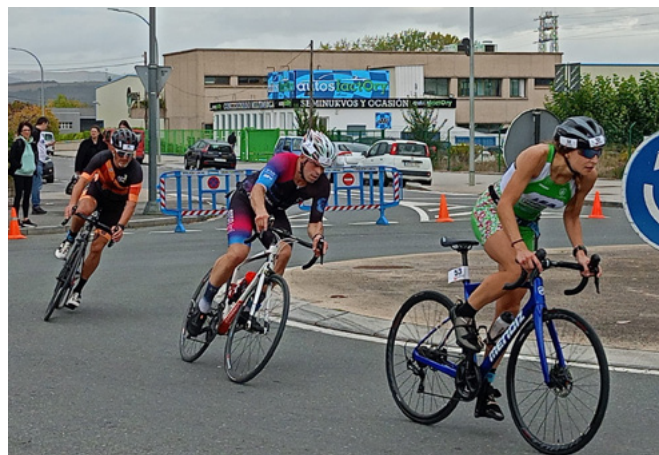
Gasteizko Duatloia 2024

2019az geroztik, Ironman proba egiten da Gasteizen, baino hori icebergaren tontorra baino ez da, azken urteetan jende ugari zaletu baita kirol horretara. 2012an, Triatloiko Munduko finala egin zen Arabako hiriburuan. Chris McCormack australiarrek lortu zuen garaipena gizonezkoetan —Eneko Llanos arabarra izan zen txapeldunordea— eta Carolina Steffen suitzarra emakumezkoetan. Geroztik, “triatloi fenomeno” esponentzialki hazten joan da. Gaur egun, hamabi klubek osatzen dute Arabako federazioa, besteak beste, Arabako hiriburuan sortutakoek: Cafés Foronda Dida, Bulletbike, E-Tri, Bertakoak, CDA 42195, Triatlhlon Aloha, LEA La Blanca, Vibike, Maldan Gora eta Sua Singular (berriki sortua). Kirolarien eta teknikarien artean, 300 federatu dira —horien ehuneko 22 emakumeak—, zeinak hiriko kirol-instalazioetan banatzen baitira errutinak eta entrenamenduak egiteko.