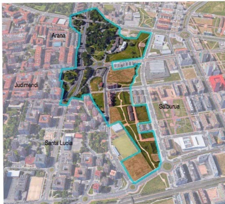
En la imagen aparece la zona de oportunidad denominada Tres Santos en el Documento Avance y sobre la que ponemos foco en este cuestionario

"Zer esan nahi du hiria josteak?" galderari erantzuteko, HAOaren idazketa-taldeak hau azaldu du: "hiria jostea harrotzea da, ingurabideak Gasteizen sortzen duen banaketa efektua (ingurabide-barrualdea eta ingurabide-kanpoaldea) desagerrarazten saiatzea. Konexioa eta barruranzko zein kanporanzko fluxuak bilatu eta erraztea da asmoa".