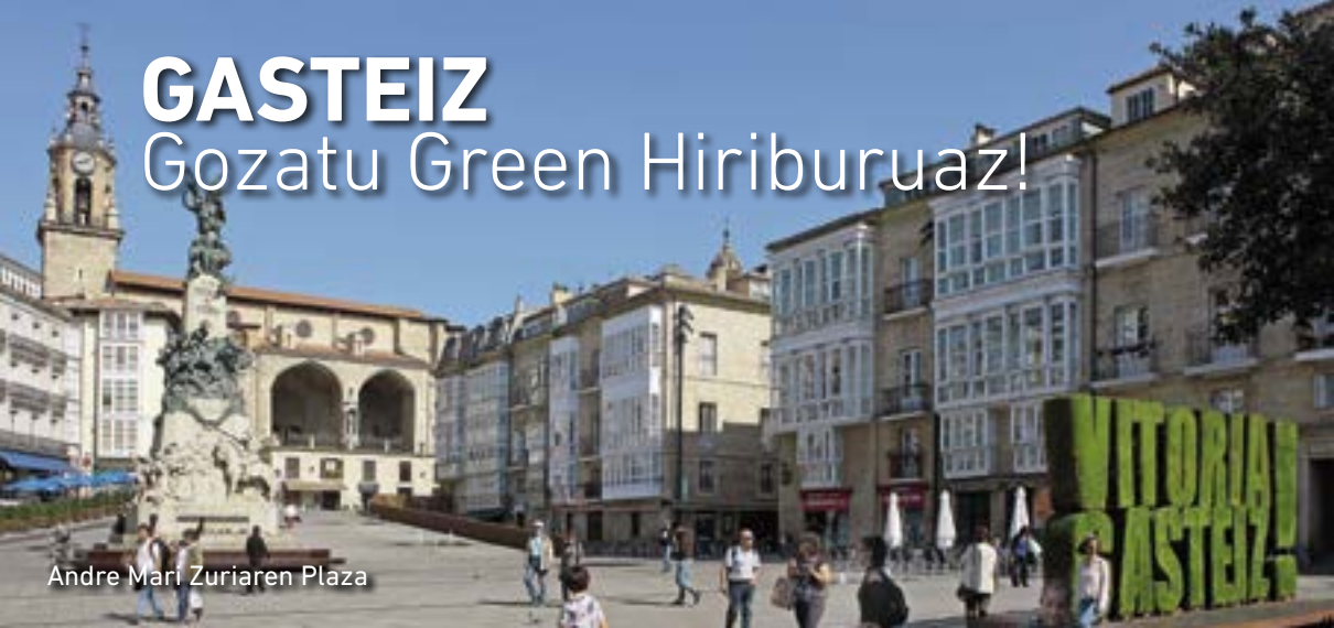
Andre Mari Zuriaren Plaza

G asteiz berez da harrigarria. Europan, berdeguneen azalera handienetakoa duen hiria da; bai pasieran ibiltzeko, korrika egiteko edo bizikletaz ibiltzeko, bai hegaziak ikusteko, bai zaldiz ibiltzeko.