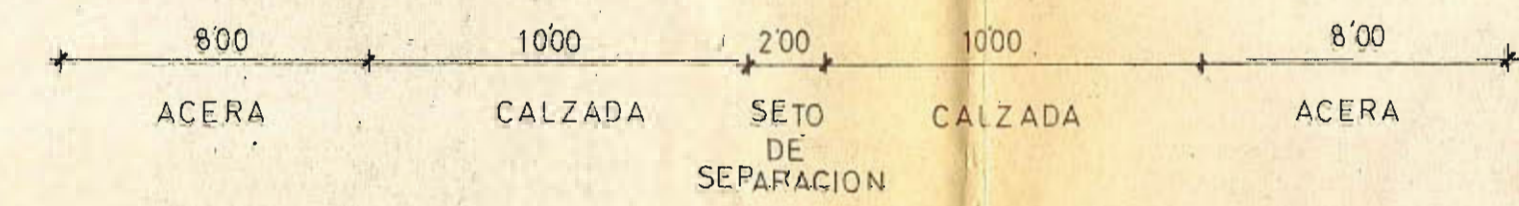
Eje Norte - Sur (entre el Puente de Castilla y B.T. de Zumarraga)