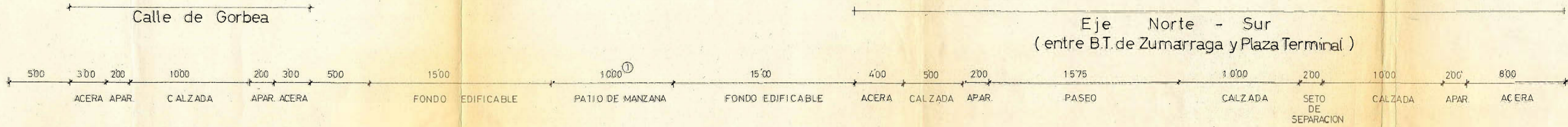
Eje Norte - Sur (entre B.T. de Zumarraga y Plaza Terminal)