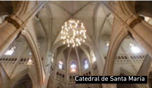
Catedral de Santa María

esconde rincones que trasladan al visitante a épocas pasadas. Es el caso de la Catedral de Santa María o Catedral vieja (sg. XIII) y la Muralla Medieval (sg. XI), ambas visitas obligadas. Sin olvidar sus iglesias y los palacios renacentistas de Villa Suso, Montehermoso y Escoriaza-Esquivel.