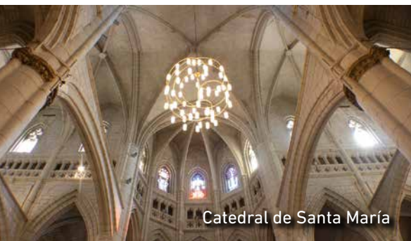
Catedral de Santa María

esconde rincones que trasladan al visitante a épocas pasadas. Es el caso de la Catedral de Santa María o Catedral vieja (sg. XIII) y la Murala Medieval (sg. XI), ambas visitas obligadas. Sin olvidar sus iglesias y los palacios renacentistas de Villa Suso, Montehermoso y Escoriaza-Esquivel.