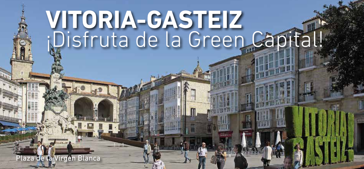
Plaza de la Virgen Blanca

V itoria-Gasteiz es sorprendente por naturaleza. Es una de las ciudades europeas con mayor superficie de espacios verdes para pasear, correr o andar en bicicleta, observar aves o dar paseos a caballo. El galardón 'European Green Capital 2012' su condición de Destino Turístico Sostenible desde 2016 y el nombramiento 'Global Green City 2019' la reconocen como una de las ciudades más comprometidas con el medio ambiente a nivel internacional. ¡Descúbrela!