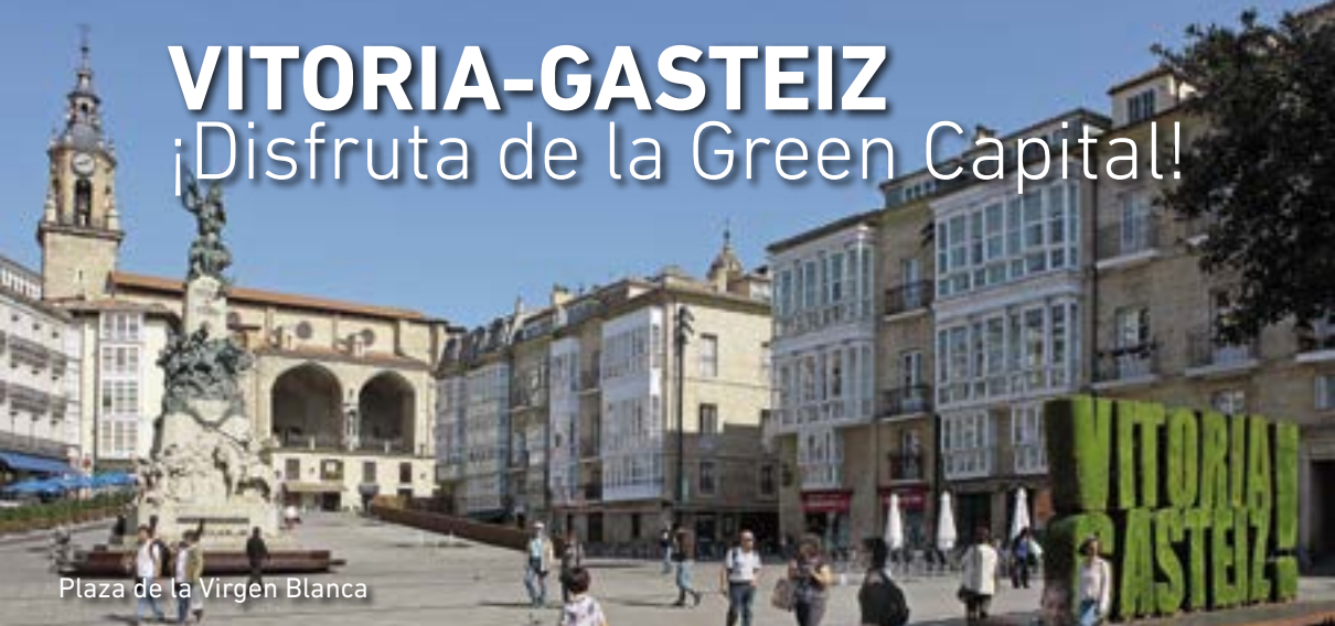
Plaza de la Virgen Blanca

V itoria-Gasteiz es sorprendente por naturaleza. Es una de las ciudades europeas con mayor superficie de espacios verdes para pasear, correr o andar en bicicleta, observar aves o dar paseos a caballo. El galardón 'European Green Capital 2012', su condición de Destino Turístico Sostenible desde 2016 y el nombramiento 'Global Green City 2019' la reconocen como una de las ciudades más comprometidas con el medio ambiente a nivel internacional. ¡Descúbrela!