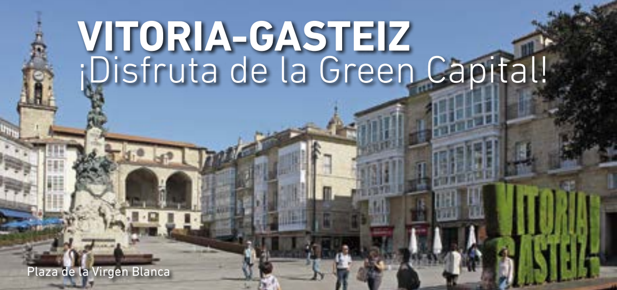
Plaza de la Virgen Blanca

V itoria-Gasteiz es sorprendente por naturaleza. Es una de las ciudades europeas con mayor superficie de espacios verdes para pasear, correr o andar en bicicleta, observar aves o dar paseos a caballo. El galardón 'European Green Capital 2012', su condición de Destino Turístico Sostenible desde 2016 y el nombramiento 'Global Green City 2019' la reconocen como una de las ciudades más comprometidas con el medio ambiente a nivel internacional. ¡Descúbrela!