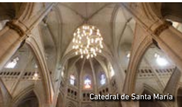
Catedral de Santa María

esconde rincones que trasladan al visitante a épocas pasadas. Es el caso de la Catedral de Santa María o Catedral vieja (sg. XIII) y la Muralla Medieval (sg. XI), ambas visitas obligadas. Sin olvidar sus iglesias y los palacios renacentistas de Villa Suso, Montehermoso y Escoriaza-Esquivel.