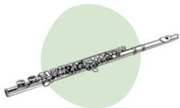
FLAUTA TRAVESERA: LINK