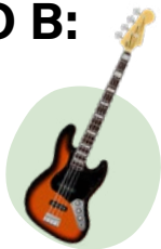
BAJO ELÉCTRICO: LINK