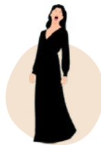
CANTO SOLISTA: LINK