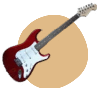
GUITARRA ELÉCTRICA: LINK