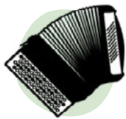
ACORDEÓN: LINK LINK