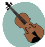
VIOLÍN: LINK LINK