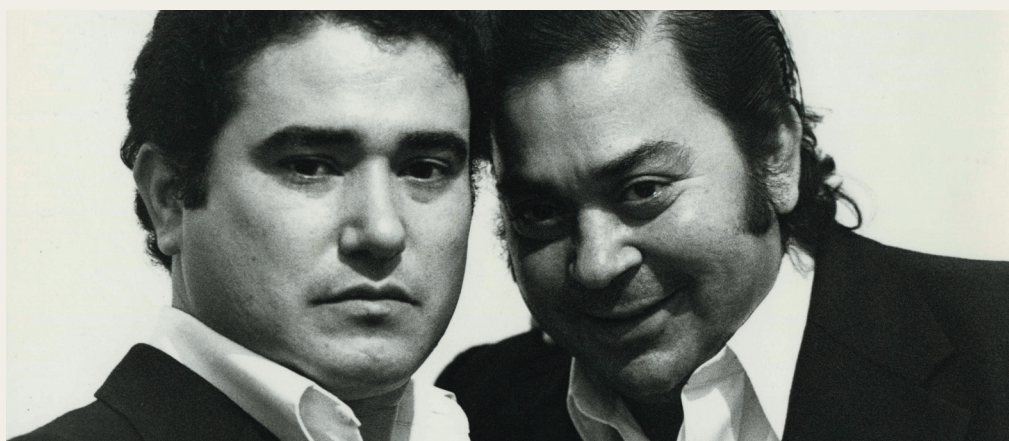
José Menese y Terremoto de Jerez-1975.

TEATRO JESÚS IBAÑEZ DE MATAUCO ANTZOKIA, 19:30 Sarrerak dagoeneko salgai / Entradas a la venta: 15€