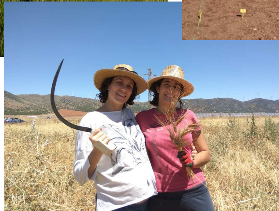
Trabajo de recuperación de variedades de trigo en Málaga. Sierra de Yeguas.