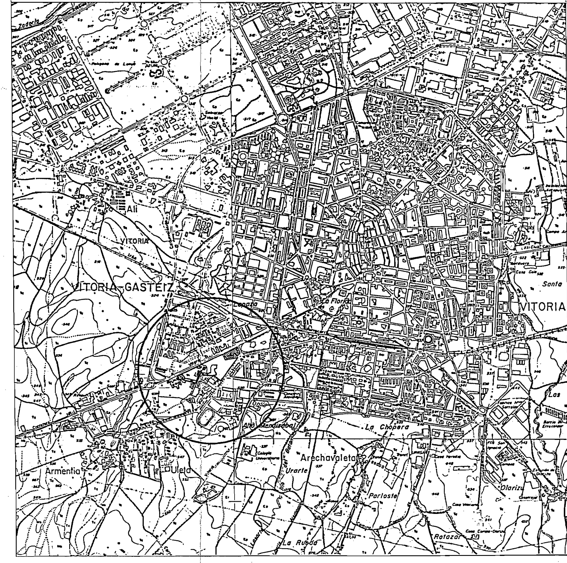
ESCALA GRAFICA 1:20000