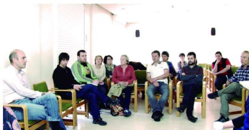
Konsumitzaileen atzetik, politikariak eta teknikariak

Home » Albisteak » Konsumitzaileen atzetik, politikariak eta teknikariak