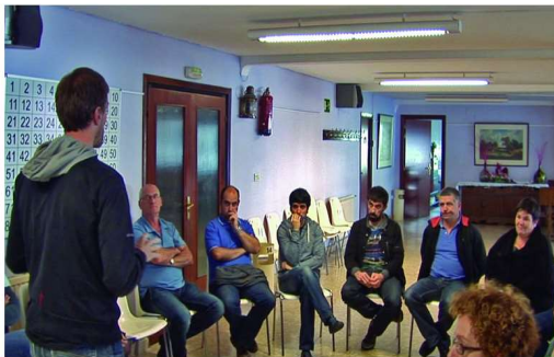
Bertatik Bertara: aro berri baten hasiera

Home » Albisteak » Bertatik Bertara: aro berri baten hasiera