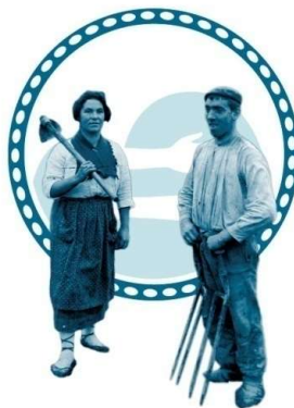
GERTUTASUNA ETA KONFIANTZA