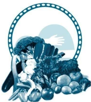
KALITATEA ETA ZAINKETA