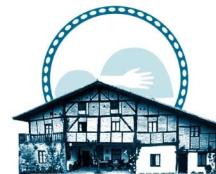
BASERRIA ETA OHITURA