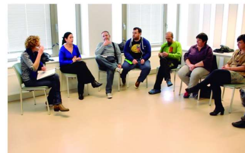
Politikariak eta teknikariak itxi dute bileren lehen fasea

Home » Albisteak » Politikariak eta teknikariak itxi dute bileren lehen fasea