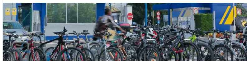
PLAN MOVILIDAD A ZONAS INDUSTRIALES

Ante esta tesitura el Ayuntamiento de Vitoria-Gasteiz ha elaborado un decreto donde se fijan los criterios para la intervención administrativa en la implantación de instalaciones de recarga de vehículos eléctricos.