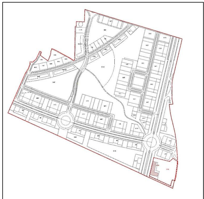
SITUACIÓN EN BASE AL SECTOR 1 "BORINBIZKARRA"