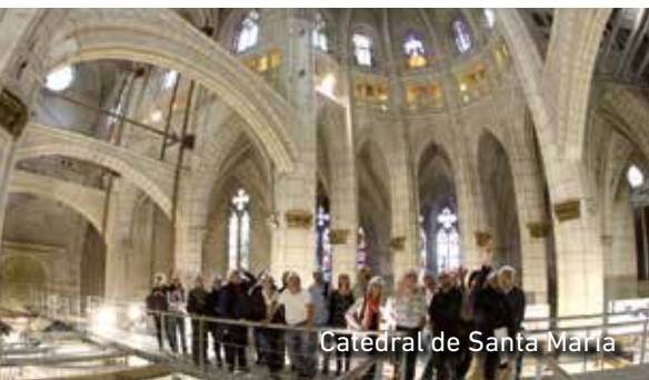
Catedral de Santa María

esconde rincones que trasladan a épocas pasadas. Es el caso de la Catedral de Santa María o Catedral vieja (sg. XIII) y la Muralla Medieval (sg. XI), ambas visitas obligadas. Sin olvidar palacios renacentistas como Villasuso, Montehermoso, y Escoriaza-Esquivel, y sus iglesias, cantones y caños.