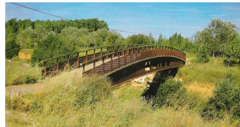
EJEMPLO DE PASO SOBRE PASARELA