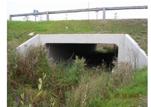
EJEMPLO DE PASO SOBRE MARCO DE HORMIGON