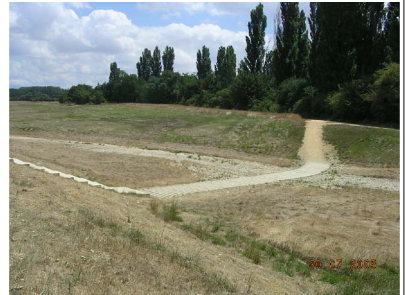
EJEMPLO DE PASO SOBRE TRAVIESAS DE HORMIGON