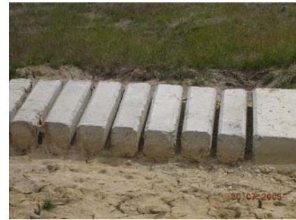
TRAVIESAS DE HORMIGON