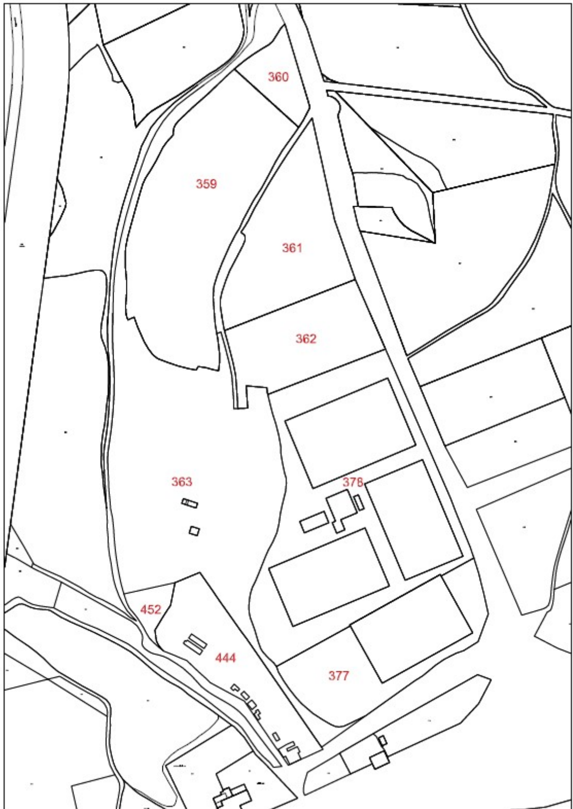
PARCELAS - IBAIA