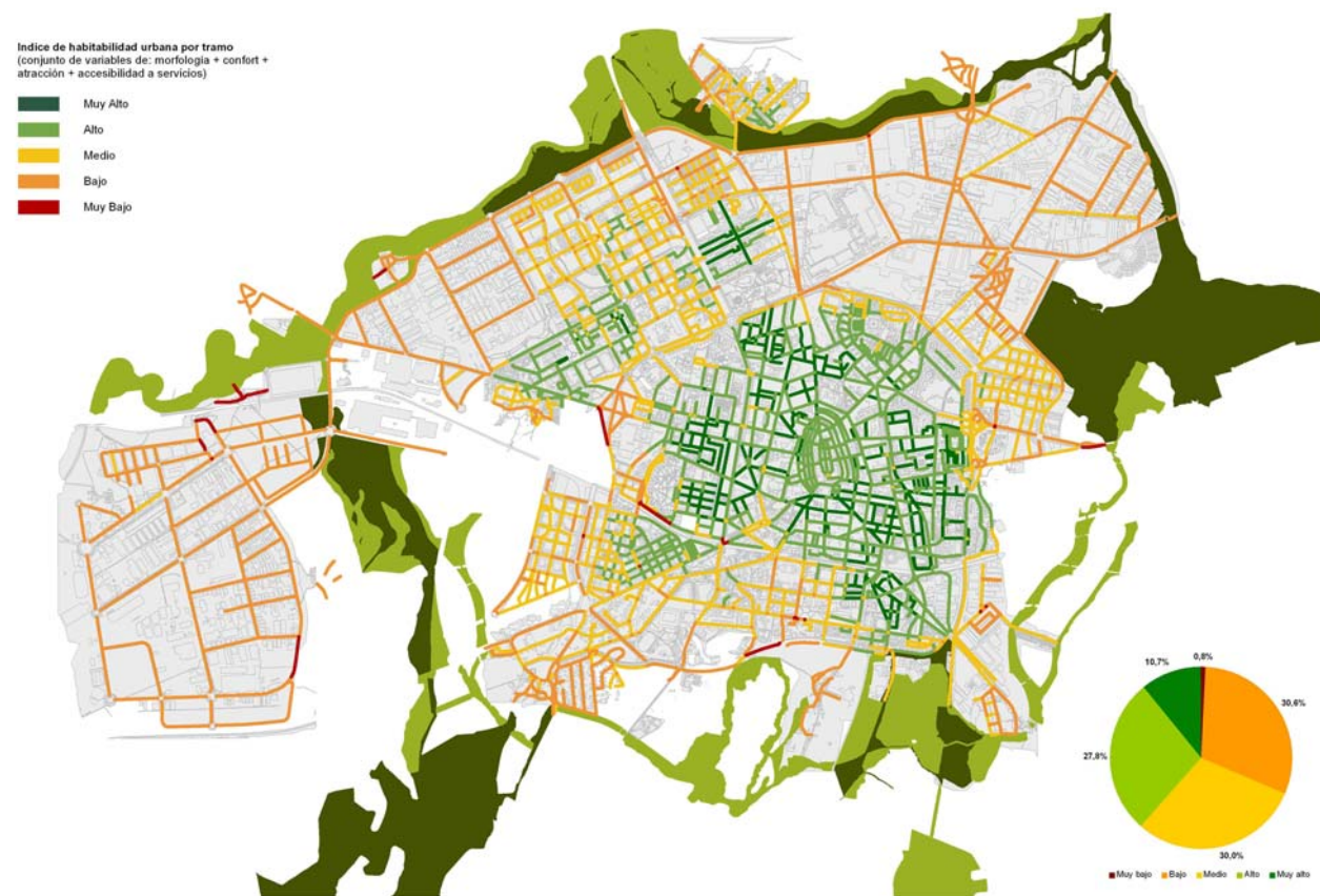
Índice de Habitabilidad urbana. Proyección de la situación actual con supermanzanas en Fase final.

El Plan de Movilidad y Espacio Público es un primer paso que permite potenciar los desplazamientos a pie de la ciudadanía y así favorecer la extensión de ejes comerciales y culturales. Los indicadores y análisis evaluados hasta este momento muestran las ventajas y ganancias que comporta su puesta en marcha.