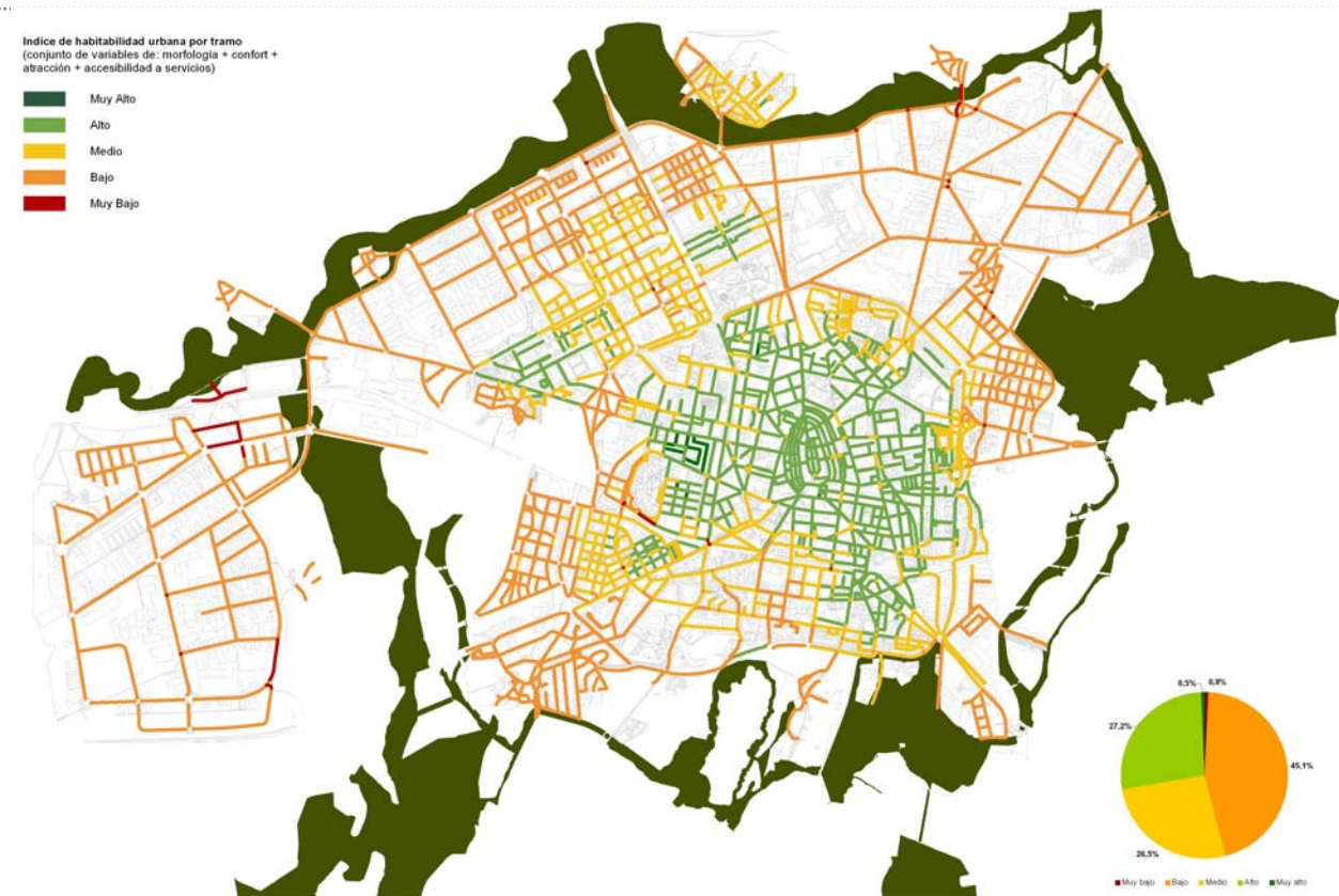
Índice de Habitabilidad urbana. Escenario Actual.

Finalmente la total implementación del Plan de movilidad, en específico las supermanzanas, significa alcanzar que el 38,5% de la extensión total de las calles se encuentre en niveles altos de habitabilidad.