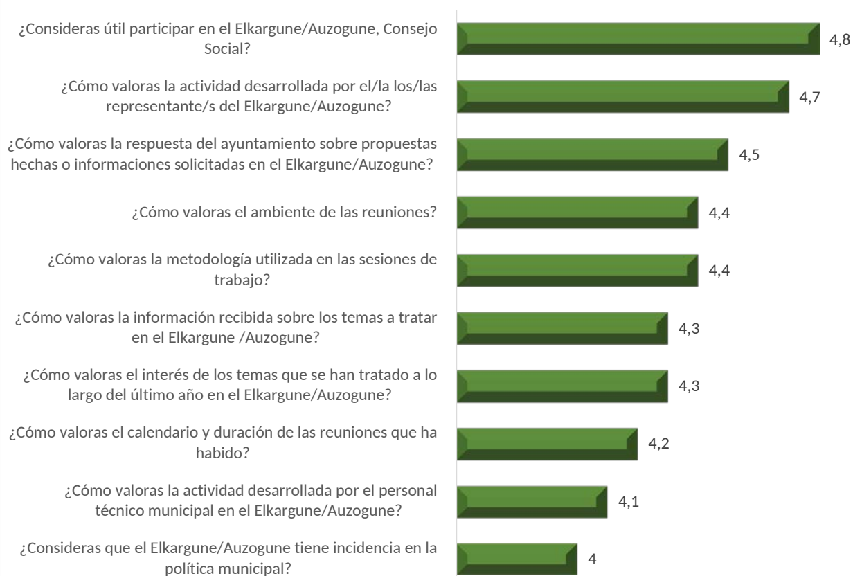
Gráfico 2: Evaluación sobre el funcionamiento de los órganos de participación del Elkargune de Infancia y Adolescencia (puntuación de 1 a 5)

Desde el Elkargune de Infancia y Adolescencia se ha participado también en este proceso de evaluación. Los resultados son muy notables, con una media de 4,4 puntos sobre 5 y ninguna valoración por debajo de 4. Estos resultados son muy esperanzadores: que las personas más jóvenes tengan una buena experiencia de participación es la mejor manera de incentivar para el futuro una ciudadanía participativa.