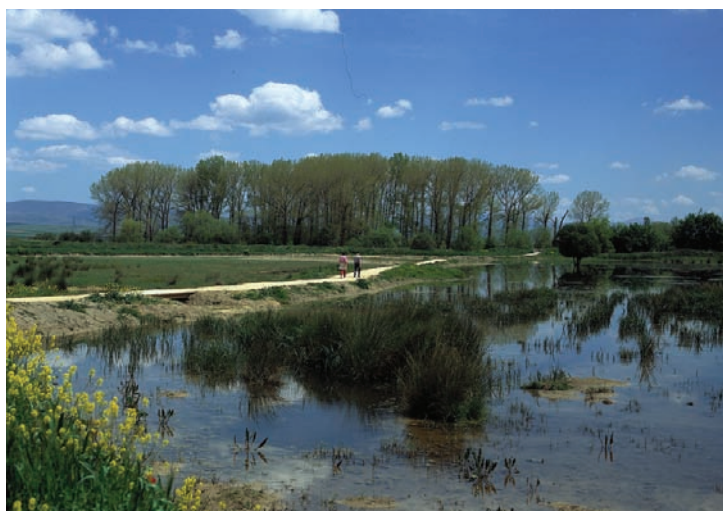
Balsa de Betoño

8,9 km.- En este punto finalizamos el recorrido, pudiendo volver al centro de la ciudad.