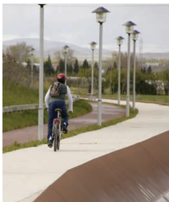
Paseo del río Alegría

Cruzamos y continuamos por el Paseo del río Alegría . Este cauce se ha habilitado como parte del Anillo Verde, ofreciendo un corredor periurbano que, rodeando el cinturón industrial, conecta el futuro Parque del Zadorra con el