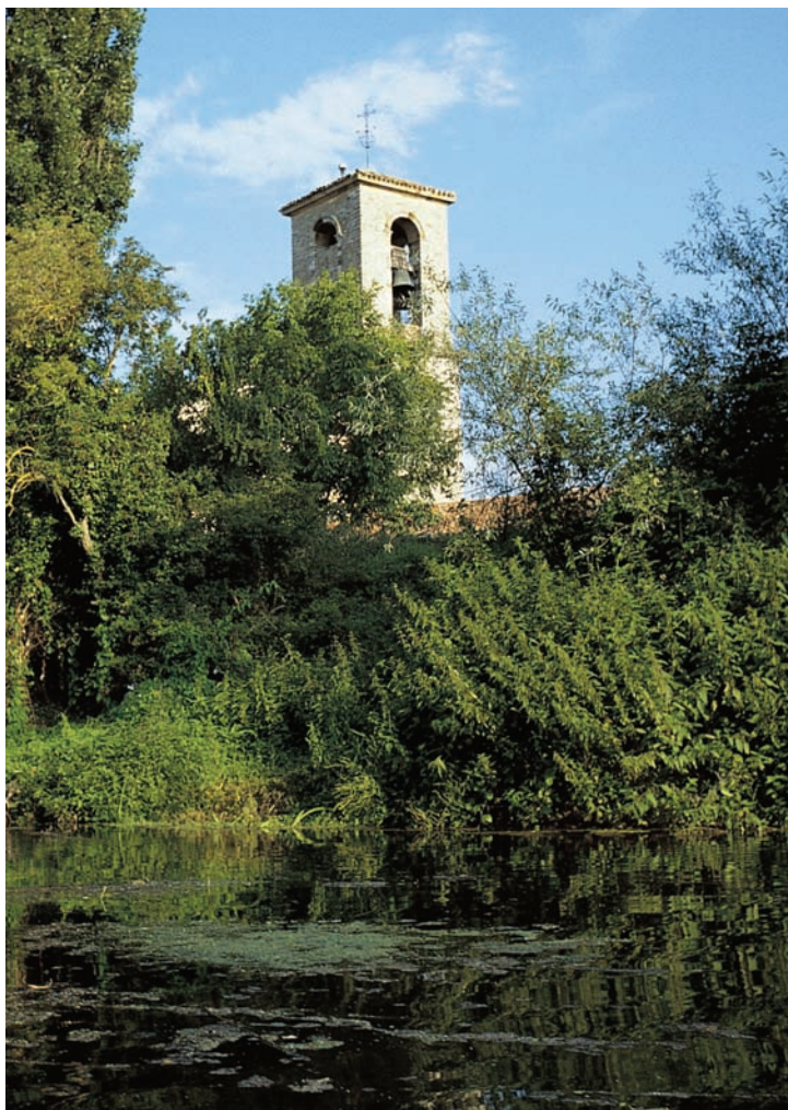
Ribera del Zadorra