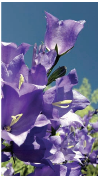
Primavera en el Anillo Verde

El bosque que atravesamos es muy diferente al bosque relíctico de Arcaute. Se compone de chopos de gran porte. Estos árboles fueron plantados y forman en la actualidad un pequeño bosque de aspecto impresionante.