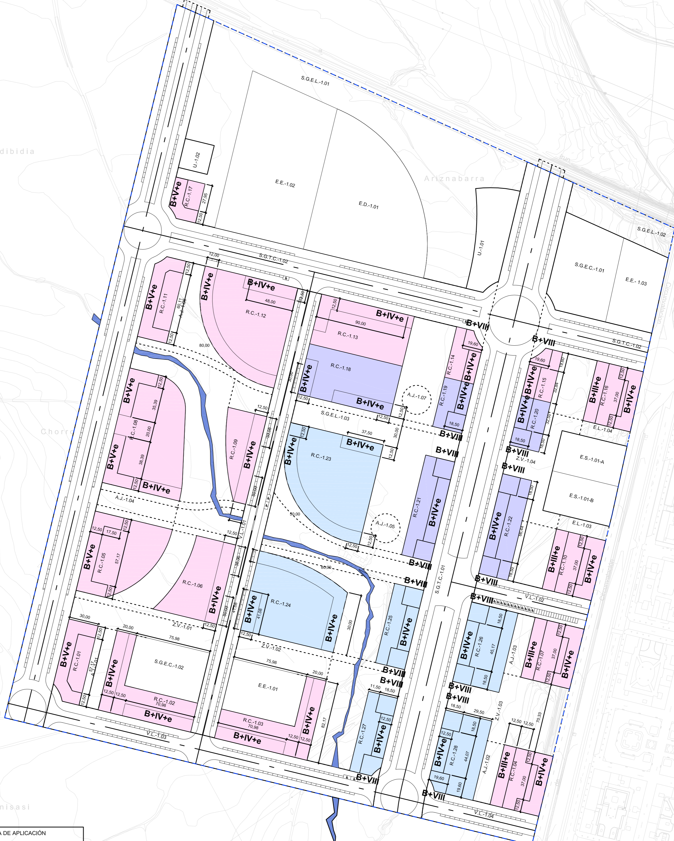
CUADRO GENERAL DE PARCELAS DE EQUIPAMIENTOS Y SERVICIOS URBANÍSTICOS