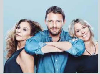
Abuztuak 4-5 Agosto PREFIERO QUE SEAMOS AMIGOS orr/pág 6