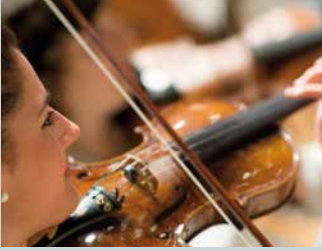
Uztailak 21 julio EUSKAL HERRIKO GAZTE ORKESTRA (EGO) orr/pág 3