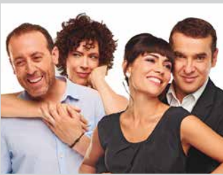
Abuztuak 6-7 agosto EL TEST orr/pág 7