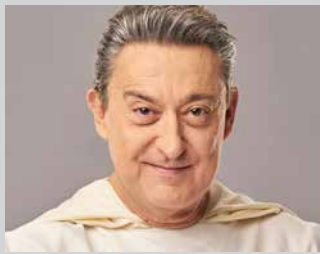
Abuztuak 8-9 agosto OBRA DE DIOS Mariano Peña orr/pág 8