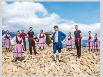
Irailak 23 septiembre LURRA ARDOA DANTZA Aurreseq orr/pág 9