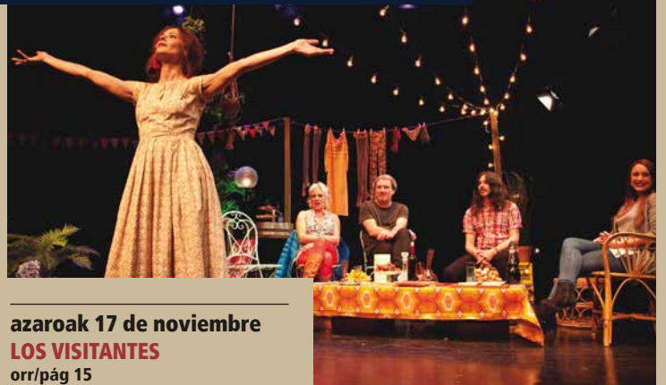
azaroak 17 de noviembre LOS VISITANTES orr/pág 15