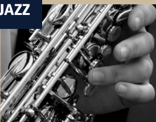
Uztailak 11-12-13-14-15 julio XXI. MENDEKO JAZZA JAZZ DEL S. XXI orr/pág 10-11