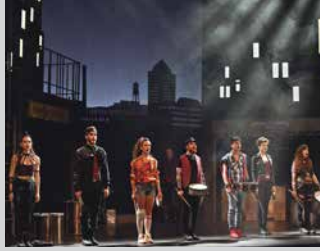
Uztailak 27-28-29 julio RUMBA. MAYUMANÁ orr/pág 4-5