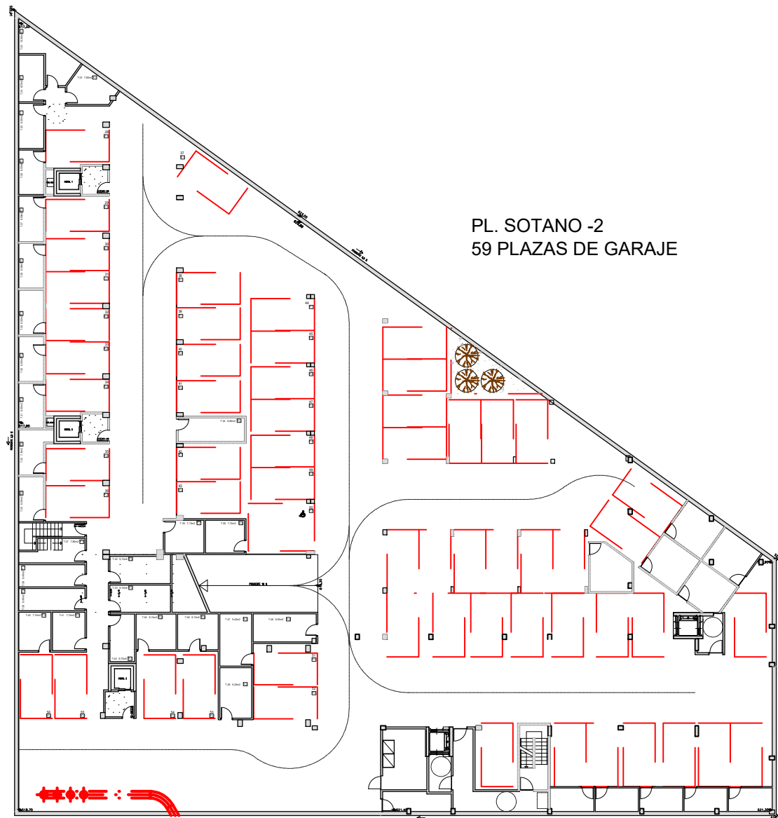
PL. SOTANO -2 59 PLAZAS DE GARAJE