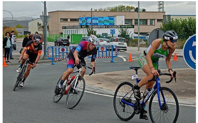
Duatlón Vitoria-Gasteiz 2024

La celebración del Ironman Vitoria-Gasteiz desde el año 2019 es sólo la punta del iceberg de un deporte que ha ido ganando personas adeptas en estos años. Desde 2012, cuando se celebró la final del Mundial de Triatlón en la capital alavesa, con el triunfo para el australiano Chris McCormack en chicos (el subcampeonato fue para el alavés Eneko Llanos) y la suiza Carolina Steffen en féminas, el "fenómeno triatlón" ha ido creciendo exponencialmente. En la actualidad son doce los clubes que forman parte de la federación alavesa, entre ellos, los creados en la capital alavesa Cafés Foronda Dida, Bulletbike, E-Tri, Bertakoak, CDA 42195, Triatlhlon Aloha, LEA La Blanca, Vibike, Maldan Gora o el de última creación Sua Singular. Un total de 300 federados entre deportistas y técnicos, un 22 por ciento son mujeres, se reparten entre las diferentes instalaciones deportivas de la ciudad para realizar sus rutinas y entrenamientos.