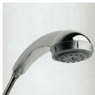
Sunami Masaje Plus