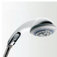
Sunami Turbo Plus