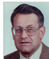
Augusto Borderas Gaztambide PSE-PSOE