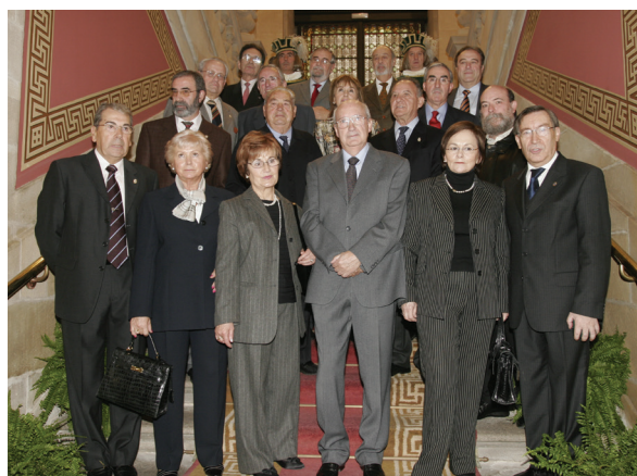
Homenaje a la primera Corporación Municipal en 2004