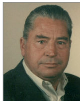
Germán Ruiz de Azua Sáez de Buruaga UCD