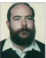
José Ángel Lecuona Laburu PSE-PSOE